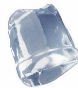
18 gr FULL ICE CUBE