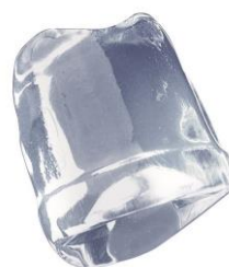
18 gr. FULL ICE CUBE