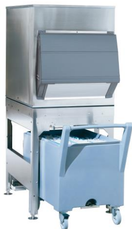
ST C 300

Polyurethane insulation, high density, and polyethylene bin interior compatible with ice contact, with rounded corners easy to clean. Stainless steel exterior on bin, and robust plastic door with resist operational abuse.