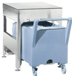
ST C 50