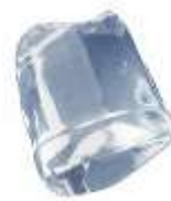
18 gr FULL ICE CUBE